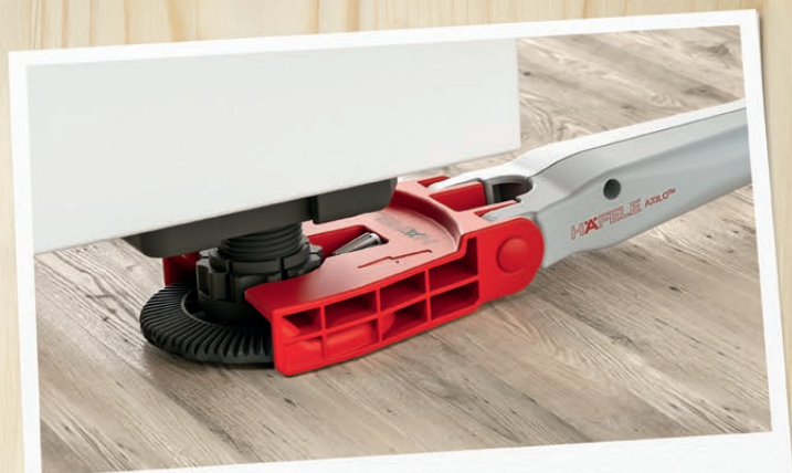
AXILO – KLUCZ DO POZIOMOWANIA

ZBIERZ 25 PUNKTÓW. ODBIERZ CZWARTY Z ZESTAWÓW HÄFELE.