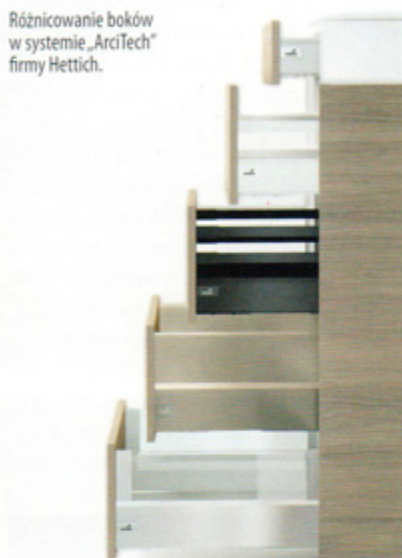
Różnicowanie boków w systemie „ArciTech” firmy Hettich.

▷ dyfikować, np. zastępując relingi boczne szklanymi podwyższeniami „DesignSide”, bez dokonywania jakichkolwiek zmiany w gotowych już meblach. A to oznacza, że szufladę, w której dotąd przechowywane były produkty zbożowe, można przekształcić w miejsce przechowywania talerzy. Aby szuflady „InnoTech” czy „ArciTech” doskonale spełniły zaprojektowane dla nich