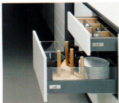
System organizacji wewnętrznej do stabilizacji produktów przechowywanych w szufladzie. Zdjęcie u góry: szuflada „InnoTech” firmy Hettich.