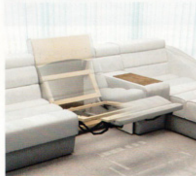
Mechanizm wielofunkcyjny SF 056-B-5 z oferty Stalmot&Wolmet może mieć zastosowanie w fotelu lub sofie w oddzielnych, pojedynczych siedziskach. Mechanizm zapewnia ergonomiczną, komfortową pozycję do wypoczynku dzięki równoczesnemu wysunięciu siedziska i podnóżka, lekkiemu pochyleniu oparcia i podniesieniu zagłówka. Jest to stelaż w pełni zmotoryzowany, sterowany przy pomocy przycisków, pilota z kablem lub sensorów. Polecany do zestawów meblowych typu TV „relax”.