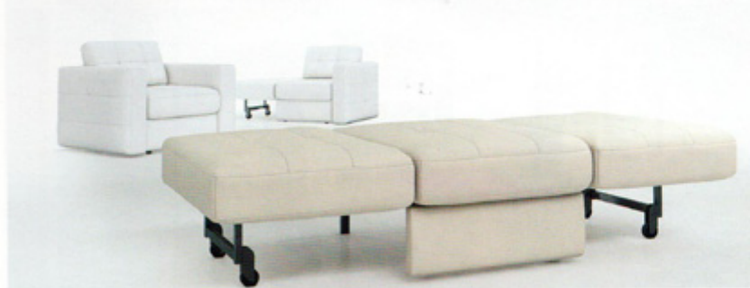
Stelaż wielofunkcyjny WU 200-B-5 produkcji Stalmot&Wolmet ma zastosowanie w fotelu. Umożliwia zamianę fotela w szezlong, a następnie tapczan do spania. Funkcja obsługiwana jest za pomocą uchwytów, za które trzeba pociągnąć, aby wysunąć i położyć boczki. Konstrukcja jest bardzo stabilna. Rozwiązanie idealne do małych pokoi dziecięcych lub jako dodatkowa powierzchnia do spania.