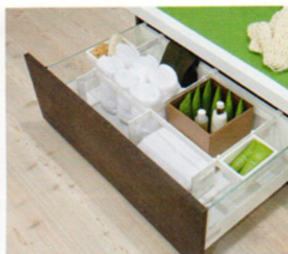
Szuflada łazienkowa na bazie platformy szufladowej „InnoTech” firmy Hettich.