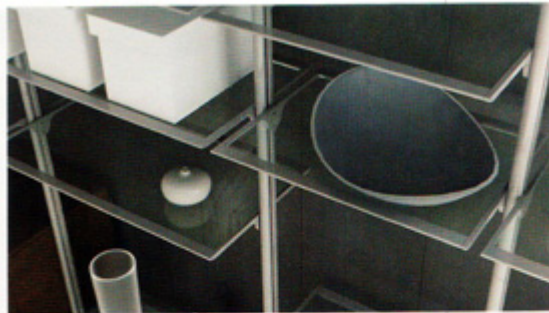
Ścienny system przechowywania „Palermo” oferowany przez firmę Cordia należy do najnowszych rozwiązań meblowych i dedykowany jest przede wszystkim osobom otwartym na niekonwencjonalną aranżację.