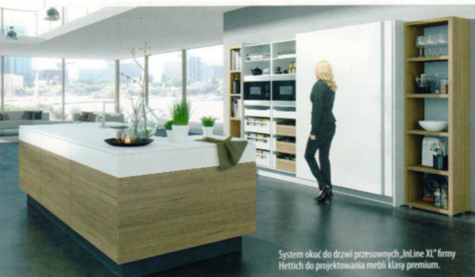
System okuć do drzwi przesuwanych „InLine XL” firmy Hettich do projektowania mebli klasy premium.