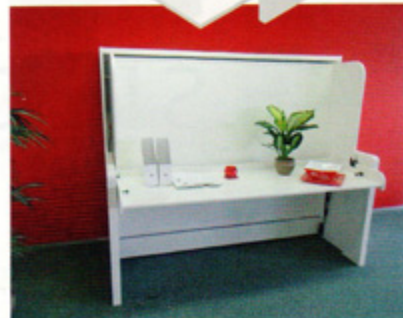
Nowoczesne okucie „Tavoletto” z oferty Häfele w wygodny sposób łączy biurko z łóżkiem. Wystarczy kilka prostych ruchów, by z małej sypialni zrobić miejsce pracy i odwrotnie.