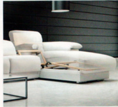
Mechanizm wielofunkcyjny SF 056-D-5 z oferty Stalmot&Wolmet może być zamontowany w otomianie narożnika lub w oddzielnym szezlongu. Umożliwia wygodną pozycję relaksu dzięki równoczesnej regulacji podparcia pod nogi, lekkiemu pochyleniu oparcia i podniesieniu zagłówka. Unikalna konstrukcja zawiasu do uchylania części pod nogi stwarza możliwość zbudowania pojemnika na pościel. Stelaż napędzany jest silnikiem elektrycznym, a sterowany przy pomocy przycisków lub sensorów.