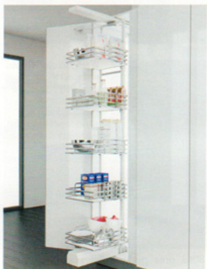
Cargo „Maxi Elite Pegasus” oferowane przez Center Mebel.