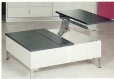
„Tavoflex” firmy Häfele jest wyjątkowo wytrzymały i odporny na częste użytkowanie.