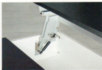
„Tavoflex” to rewolucyjny podnośnik firmy Häfele, który zamienia stolik kawowy w nowoczesny mebel do pracy z laptopem oraz schowek na książki, prasę lub drobną elektronikę.