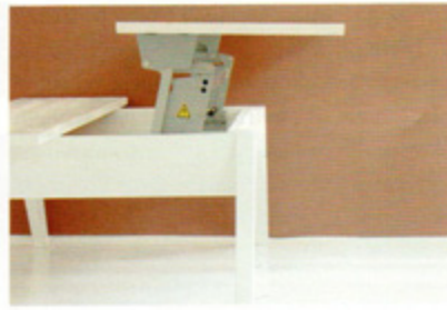
W przypadku podnośnika „Tavoflex” firmy Häfele, część blatu stolika unosi się, tworząc komfortową strefę roboczą, jednocześnie dając dostęp do wnętrza mebla.