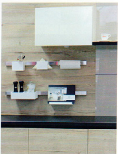
Pomysł na aranżację przestrzeni: system pojemników „Praktika” firmy Center Mebel.

▷ pod rozsuwanymi półkami. Ponowne schowanie wkładki następuje po lekkim rozciągnięciu blatu i złożeniu obu połówek blatu w całość. Podnośnik pneumatyczny 8070 podnosi blat przy pomocy siłowników gazowych – pneumatycznie bez użycia siły oraz bezstopniowo. Wbudowany mechanizm sprężyny gazowej zapewnia szybkie, proste, płynne oraz precyzyjne regulowanie blatu. Podnośniki oferowane są w różnych wymiarach oraz z różnymi silami.