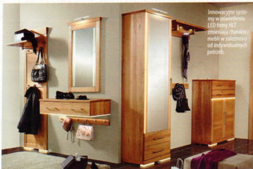
Innowacyjne systemy w oświetleniu LED firmy HLI zmieniają charakter mebli w zależności od indywidualnych potrzeb.