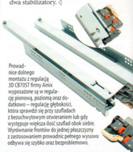
Prowadnice dolnego montażu z regulacją 3D CB705T firmy Amix wyposażone są w regulację pionową, poziomą oraz dodatkowo – regulację głębokości, która sprawdza się przy szufladach z bezuchwytywym otwieraniem lub gdy występuje większa ilość szuflad obok siebie. Wyrównanie frontów do jednej płaszczyzny z zastosowaniem prowadnic pełnego wysuwu odbywa się szybko oraz bezproblemowo.

przestrzeń pomiędzy podłogą a sufitem. Podczas wykonywania wysokich drzwi szafy z materiałów płytowych drewnopochodnych (płyta wiórowa) o grubości 16 do 25 mm, można spotkać się z problemem zbyt dużej wiotkości materiału i brakiem zachowania płaszczyzny. Rozwiązaniem tego problemu jest zastosowanie stabilizatora art. nr 0684 700 054 firmy Würth, który prostuje i usztywnia front szafy. Maksymalna długość stabilizatora to 2.320 mm. To oznacza, że stabilizatora możemy użyć nawet do drzwi o wysokości 2.500 mm. Elementy ściągnięte są gwintowane na całej długości, istnieje więc możliwość przycięcia ich i dopasowania do frontów o mniejszej wysokości. Nie bez znaczenia jest średnica prętów ściągniętych – wynosi ona 8 mm. Masywny pręt pozwala uzyskać bardzo wysoką siłę ściągniętą. Po przygotowaniu otworów w skrzydłach, montaż stabilizatora jest bardzo prosty. Wysoka tuleja gwintowana z nawierconymi otworami zapewnia łatwą i komfortową regulację. Po regulacji skrzydła, elementy są wyprostowane i gotowe do dalszego montażu. W zależności od szerokości skrzydeł stosowany jest jeden bądź dwa stabilizatory. ◁