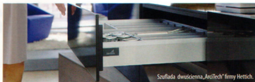
Szuflada dwuszcienne „ArcTech” firmy Hettich.

„Push Latch” firmy Titus jest uniwersalnym produktem, który pasuje do wielu szafek i szuflad, można go stosować zarówno w meblach kuchennych, jak i w łazienkowych, sypialnianych i biurowych. Służy do bezwysiłkowego otwierania poprzez naciśnięcie frontu szafki lub szuflady. Wszechstronność i funkcjonalność „SB10 System Box” firmy Amix przyczyniają się do rosnącego zainteresowania polskich oraz zagranicznych odbiorców. Sukcesywnie poszerzany jest o nowe modele, kolory oraz długości. Pozwala na skonstruowanie szuflad na miarę potrzeb i upodobań