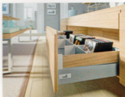
„InnoTech Atira” to nowa linia wzornicza firmy Hettich bazująca na sprawdzonych rozwiązaniach platformy szufladowej „InnoTech”, dostępna w Polsce w II kwartale 2016 roku. Na zdjęciu: szuflada dwuścienna w meblach pokojowych.

tro" w systemie „ArciTech”) oraz pozostałe elementy boczne. To właśnie boki szuflad pozwalają doskonale różnicować jej funkcję. Inaczej wyobrażamy sobie bok szuflady kuchennej – który może być zakończony relingiem, ale już szuflada w wyspie kuchennej będzie elegancko otwierała się na salon z boku wykonanym z drewna czy wysokiej jakości tworzywa. Z kolei w łazience kosmetyki będą pięknie się prezentowały przez przeszklony bok szuflady – zaznaczają. Te wszystkie opcje są możliwe z „InnoTech” oraz „ArciTech” poprzez dobranie odpowiedniego boku z szerokiej gamy proponowanych przez Hettich rozwiązań. Co ciekawe, nawet szuflady wewnętrzne, tak bardzo modne w projektowaniu garderób czy spiżarni są również projektowane w ramach tej samej platformy „ArciTech” i „InnoTech”, dając producentom mebli na indywidualne zamówienie niezwykle narzędzie pracy – podkreślają przedstawiciele firmy Hettich. Koncepcja platformy produktowej to także rozwiązanie pozwalające na zmianę funkcji mebla w trakcie jego użytkowania, ponieważ szufladę „ArciTech”, „InnoTech” czy najnowszy system „InnoTech Atira” można w każdej chwili zmo-