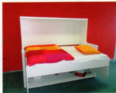
„Tavoletto” firmy Häfele to oszczędność miejsca w pokoju. Łatwe rozkładanie i składanie. Idealne rozwiązanie do pokoju dziecięcego lub funkcjonalnej kawalerki. Samo okucie wyróżnia łatwość i szybkość montażu.